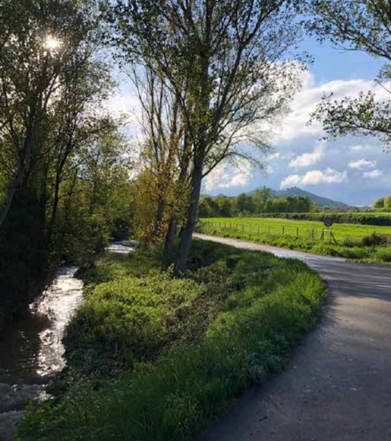
MHÀ, ESTUDI GRÀFIC · DL: L 107-2021 · FOTOGRAFIES de l'arxiu de Solsona Turisme. PORTADA: torrent de Ribalta (Victor Pallarès). CONTRAPORTADA: riu Negre (Trini Pià). INTERIOR: camí del riu Negre (Cristina Cabestany); camí del Torrent Ribalta (Victor Pallarès)