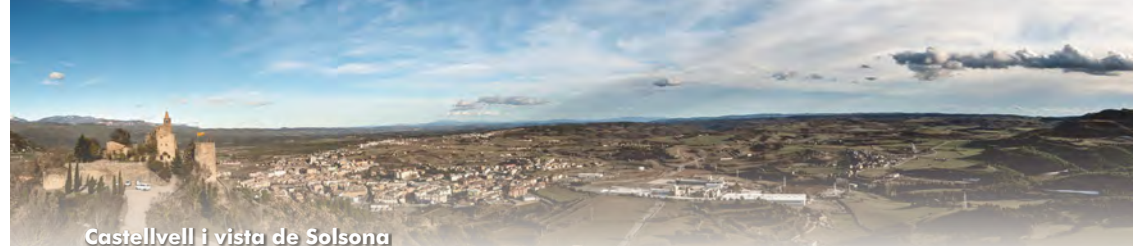
Castellvell i vista de Solsona

Dalt del turó, a 848 metres d’altitud i a 130 metres damunt la ciutat, trobem les restes de l’ antic castell de Solsona , actualment ubicat en el terme municipal d’Olius. El Castellvell senyoreja la ciutat i és una excel·lent talaia per observar Solsona i contemplar bona part de la geografia comarcal. Es remunta al segle X i s’ha anat transformant al llarg dels segles. Hi podem observar entre d’altres vestigis