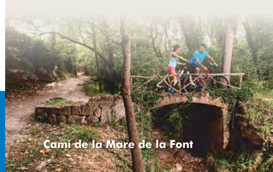
Camí de la Mare de la Font