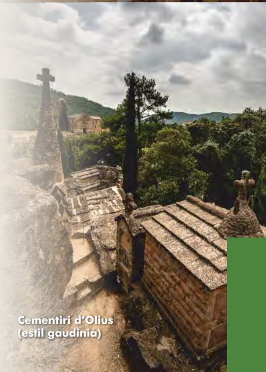
Cementiri d'Olius (estil gaudinià)

destacats de Catalunya. A l'entorn de l'església es poden visitar les restes d'un complex arqueològic ibèric del segle III aC format per un poblat, les restes de la muralla i un extens camp ple de sitges (forats excavats per emmagatzemar el cereal). També es pot visitar l'original cementiri modernista , integrat a la natura, que va dissenyar el 1915 l'arquitecte Bernardí Martorell, influenciat per l'estil d'Antoni Gaudí. Tot el nucli d'Olius es troba a escasos metres del riu Cardener, paratge ecològicament interessant pel seu bon estat de conservació i per les espècies fluvials que acull.