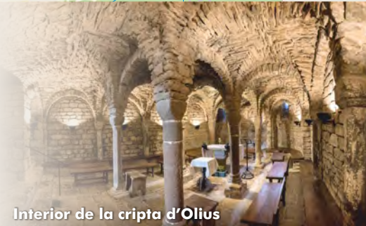
Interior de la cripta d'Olius

destacats de Catalunya. A l'entorn de l'església es poden visitar les restes d'un complex arqueològic ibèric del segle III aC format per un poblat, les restes de la muralla i un extens camp ple de sitges (forats excavats per emmagatzemar el cereal). També es pot visitar l'original cementiri modernista , integrat a la natura, que va dissenyar el 1915 l'arquitecte Bernardí Martorell, influenciat per l'estil d'Antoni Gaudí. Tot el nucli d'Olius es troba a escasos metres del riu Cardener, paratge ecològicament interessant pel seu bon estat de conservació i per les espècies fluvials que acull.