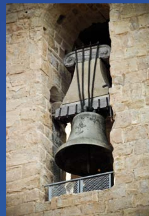
Grafame: MHA disseny - Fotografies: S. Alarcón, V. Pallarés, H. Rovira, G. Sanguinetti - 4 Imprès a Lleida - D.L: L741/2013

De dilluns a dissabte / De lunes a sábado: 9-13 h i 16-20 h Festius / Festivos: 9-13 h i 16-18 h